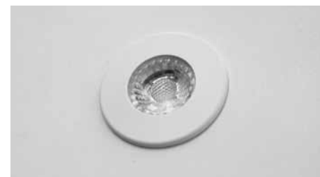
Installation of Cabinet Light using the Fixation ring